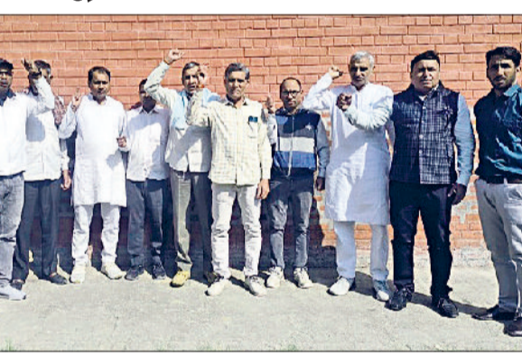
भिवानी। पुरानी पेंशन बहाली को लेकर रोष जताते कर्मचारी।