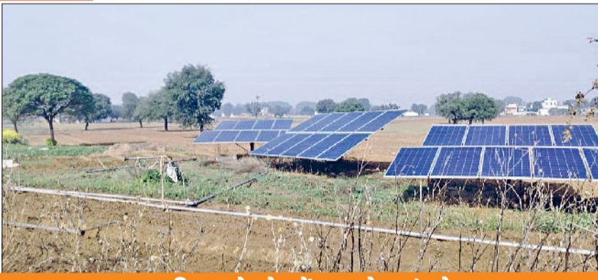
एक किसान के खेत में लगा सोलर पंप सेट

जिले में पांच से सात पहले जिन किसानों ने अपने खेतों में सोलर पंप सेट लगवाए थे, वह उनकी सिंचाई की जरूरतों के हिसाब से उम्मीदों पर खरा नहीं उतरे। पंप सेट लगाने वाले कंपनियों ने क्षमता के अनुरूप पैनाल उपलब्ध कराने से गुरेज तो किया ही, साथ ही उनकी गुणवत्ता पर भी ज्यादा ध्यान नहीं दिया गया। सोलर पंप सेट को चलाने वाले पैनाल पर्याप्त बिजली पैदा करने में कारगर साबित नहीं हुए, जिस कारण पंप सेट भी पर्याप्त पानी की आपूर्ति नहीं कर पाए।