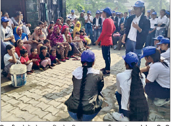
भिवानी। लोगों को नशामुक्ति के प्रति जागरूक करती छात्राएं।