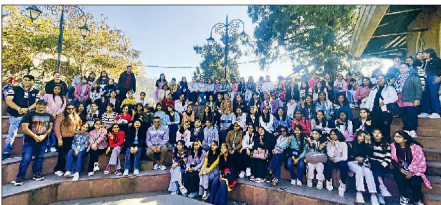
रेवाड़ी। शैक्षणिक भ्रमण के दौरान शिक्षकों के साथ विद्यार्थी।

राज इंटरनेशनल स्कूल के नौवीं और दसवीं कक्षा के छात्रों ने शिक्षकों और स्कूल प्रबंधन के साथ शिमला और कुफरी का शैक्षणिक भ्रमण किया। तीन दिवसीय दौरे में छात्रों ने खूब मस्ती की और भारत के सबसे लोकप्रिय पर्यटन स्थलों के इतिहास और संस्कृति के बारे में महत्वपूर्ण जानकारी प्राप्त की। छात्रों ने हिमाचल प्रदेश की राजधानी शिमला के कई प्रमुख आकर्षणों का पता लगाया। विद्यार्थियों ने जाखू हिल और हनुमान मंदिर के अद्भुत मनोरम