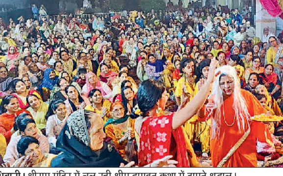
भिवानी। श्रीराम मंदिर में चल रही श्रीमद्भागवत कथा में झूमते श्रद्धालु।