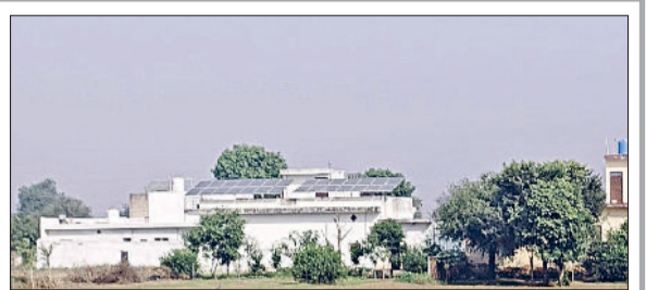
रेवाड़ी। खेत से हटाकर मकान की छत पर लगाए गए पैनाल।

लगभग तीन साल पहले प्रदेश सरकार ने कृषि क्षेत्र में बिजली कनेक्शन पर लगी रोक हटा दी थी। इसके बाद बड़ी संख्या में किसानों ने नए कनेक्शनों के लिए आवेदन किए थे। अब इन किसानों को बिजली कनेक्शन मिलने शुरू हो गए हैं। तीन एकड़ या इससे अधिक जमीन वाले किसान बिजली कनेक्शन लेकर अपने खेतों से सोलर पंप सेट हटा रहे हैं। सोलर पंप सेटों के पैनालों को घरों में लगाकर इस्तेमाल किया जा रहा है, ताकि घरेलू बिजली का बिल कम हो सके।