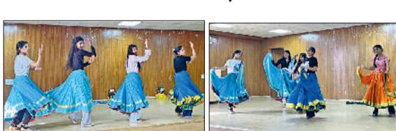
मीरपुर। आईजीयू में युवा महोत्सव की तैयारी करती छात्राएं। व आईजीयू में युव डांस की रीहर्सल करती छात्राएं।

इंदिरा गांधी विश्वविद्यालय में 17 नवंबर से इंटर जोनल युवा महोत्सव हिंडोला का आगाज होगा। 18 नवंबर को युवा महोत्सव का समापन किया जाएगा। दो दिन चलने वाले युवा महोत्सव के लिए सभी तैयारियां पूरी कर ली गई हैं। यूथ फेस्टिवल के लिए आईजीयू में 6 मंच बनाए गए हैं। युवा महोत्सव में रेवाड़ी व महेंद्रगढ़ के 40 कॉलेजों के करीब 1500 विद्यार्थी