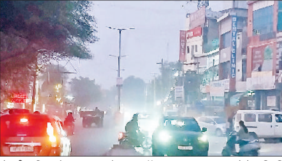
रेवाड़ी। रविवार देर शाम शहर में छाया सांभों।

आसमान साफ रहने के कारण तेज धूप निकलती है, जो ठंड से राहत देने का काम करती है। तापमान में कमी आने के कारण माह के अंत तक कड़ाके की ठंड देखने को मिल सकती है। रविवार को भी सुबह से ही आसमान साफ बना रहा। दस दिनों से आसमान साफ बना हुआ है। अधिकतम तापमान 1.0 डिग्री सेल्सियस गिरकर 26.5 डिग्री पर आ गया। रात का तापमान 0.5 डिग्री सेल्सियस की वृद्धि के साथ 6.5 डिग्री सेल्सियस दर्ज किया गया। इससे दिन के समय ठंड का असर