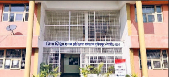
रेवाड़ी। हुसैनपुर स्थित जिला शिक्षा एवं प्रशिक्षण संस्था।