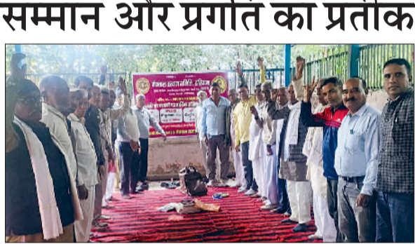
रेवाड़ी। मेघवाल उत्थान समिति की बैठक में मौजूद समाज के लोग।